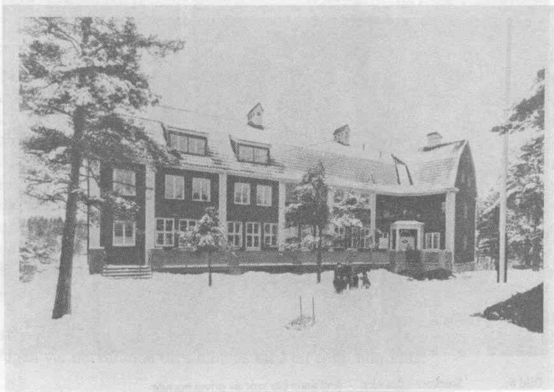
Bild 3. Skolhemmet å Lidingö

1915. Detta år öppnades ett skolhem på Lidingö för vanföra barn i skolåldern, främst sådana som drabbats av barnförlamning.