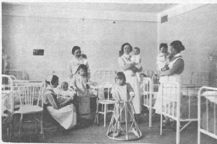
Bild 6. Interiör från den 1913 nyöppnade barnkliniken

En svår barförlamningsepidemi (polio) hade drabbat landet 1911 och 1912, vilket föranledde en riksinsamling som inbringade 600 000 kronor. En del av dessa pengar överlämnades till föreningen för uppförandet av detta skolhem. Barn som drabbats av förlamning efter sin sjukdom och inte kunde få skolgång i sin hemkommun kunde tas in på skolhemmet. Många av dem som varit intagna på "vanförestaltens" sjukavdelning behövde genom dess försorg ha fortsatt medicinsk tillsyn. Grundtanken att förena social omvårdnad och skolgång med läkarvård kunde på så sätt förverkligas.