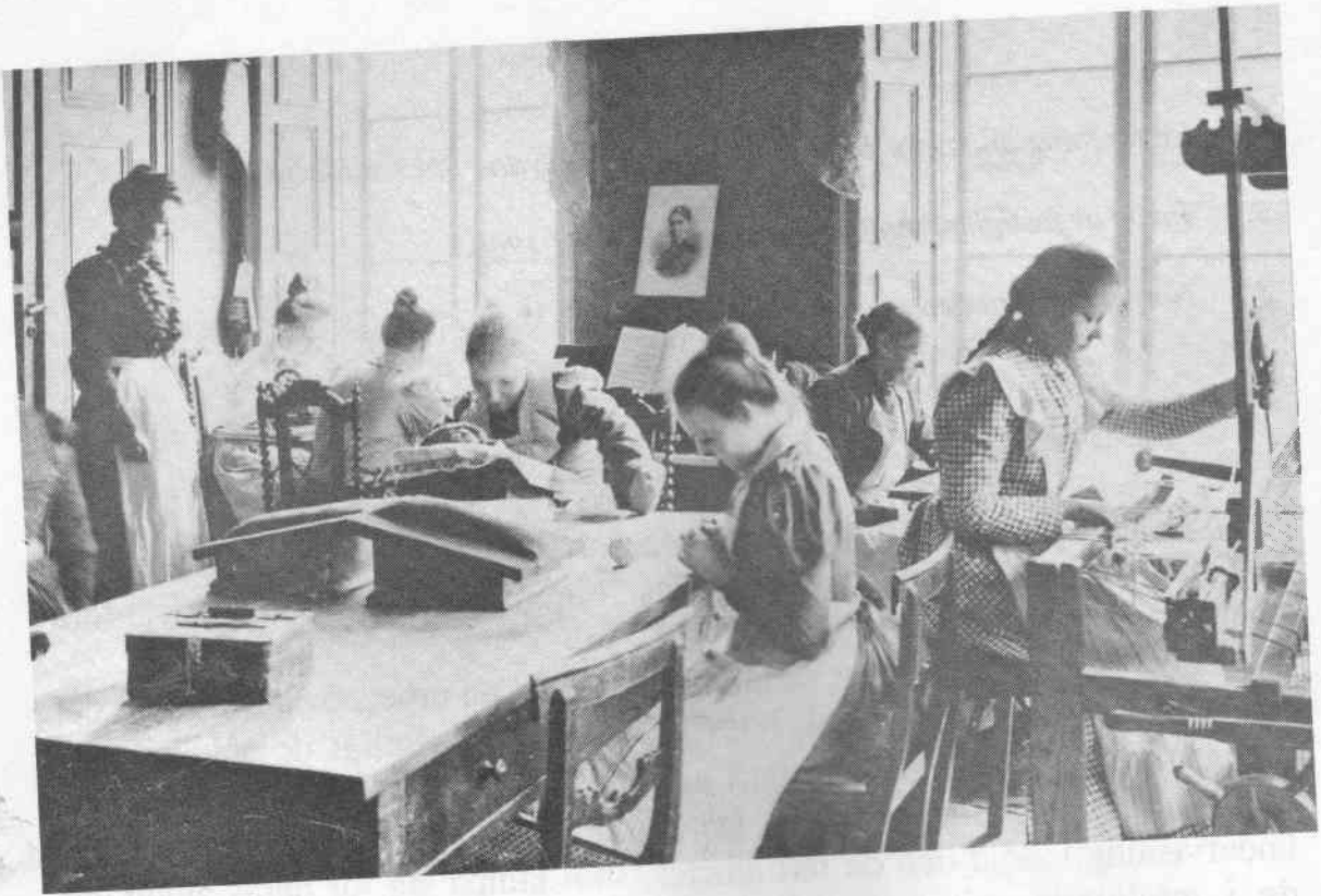
Bild 1. Undervisning i sömnad, vävning, virkning m m