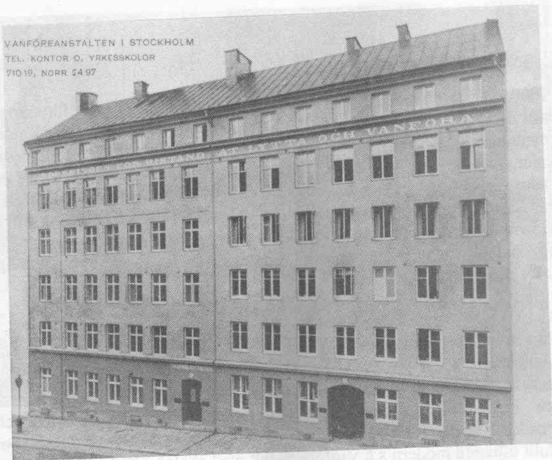
Bild 4. Vanföreanstalten i Stockholm Grevturegatan 59 - 61

VANFÖREANSTALTEN I STOCKHOLM TEL. KONTOR O. YRKESSKOLOR 710 19, NORR 24 97